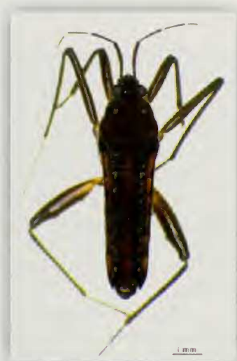
Fig. 10.- Habitus de Velia ( Plesiovelia ) lindbergi Tam. (♂)

Coloniza los arroyos donde el agua fluye lenta, especialmente en las zonas húmedas y umbrías de los bosques de laurisilva. Pueden verse cerca de la orilla, en estos tipos de ambientes. Igualmente, pueden localizarse en algunas pozas formadas en los cauces de los barrancos donde predomine la umbría, así como en determinados estanques y presas con estas peculiaridades. Además, en la mayoría de los enclaves acuáticos en las que se ha colectado este taxón, han aparecido también ejemplares de otra especie: Hydrometra stagnorum (L.).